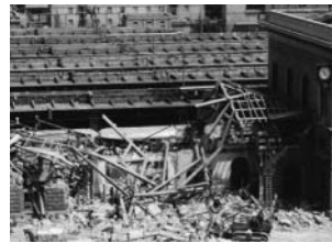
Der Anschlag auf den Wartsaal des Bahnhofs Bologna vom 2. August 1980 forderte 85 Tote und 200 Verletzte. Es war der schwerste staatliche Terroranschlag während des Kalten Krieges. Interessanterweise figuriert der Anschlag nicht auf der Liste «bedeutender globaler terroristischer Ereignisse zwischen 1961 und 2001» des US State Departments.

Während der Forschung für meine Doktorarbeit habe ich bei