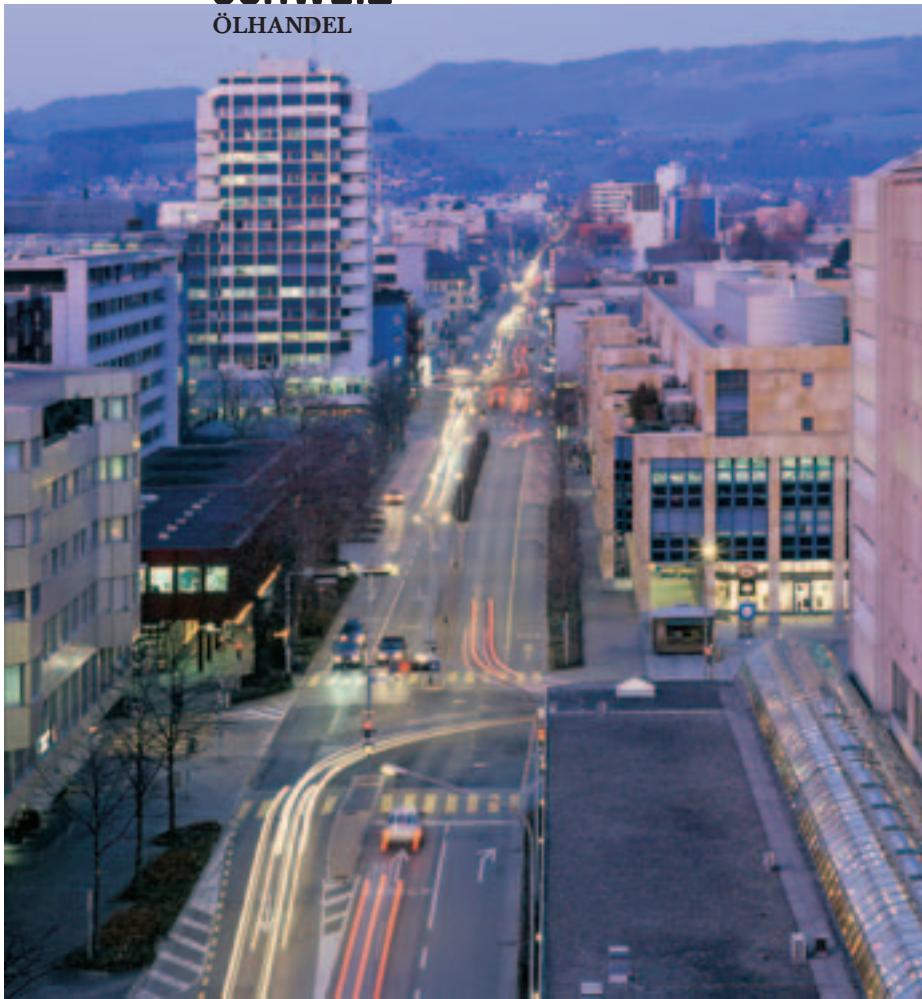
ROHSTOFFHANDELSMETROPOLE ZUG: Sitz von Glencore, einem der wichtigsten Ölhändler.

dalgeschüttelten französischen Erdölkonzerns Elf-Aquitaine war wiederholt das Ziel von Attentaten.