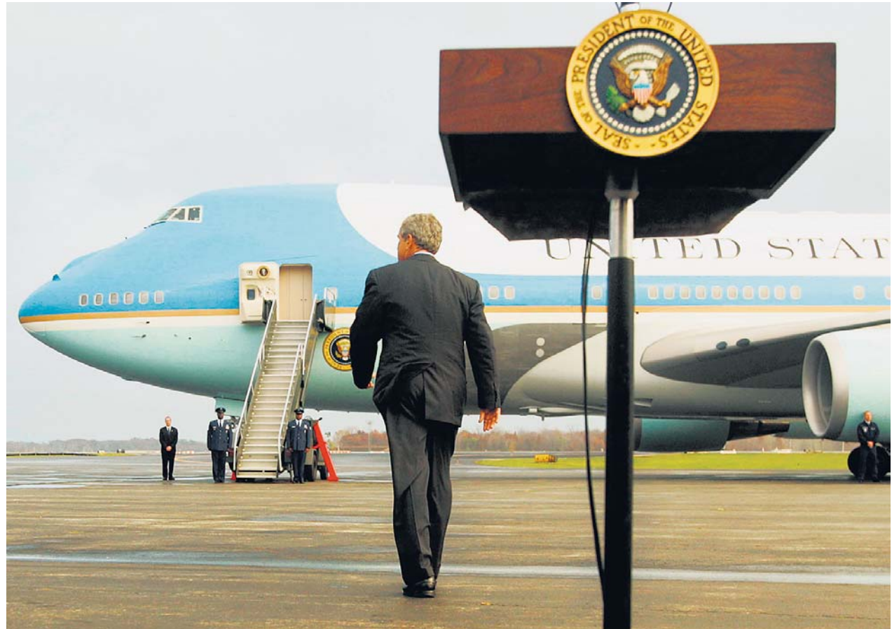
Was wusste Bush? Der Präsident auf dem Weg zur «Air Force One».

Einerseits die rein muslimische Verschwörung. Bin Laden macht die Planung gemeinsam mit Khalid Scheich Mohammed, und Mohammed Atta führt zusammen mit 19 anderen Attentätern den Anschlag aus. Die haben sich alle auch untereinander abgesprochen, das heisst, ihre Aktion erfüllt alle Kriterien einer Verschwörung. Nur ist der ganze öffentliche Diskurs geprägt von Bushs Aussagen vor der UNO, einen Monat nach den Anschlägen. Da sagte er nämlich, er würde keine Verschwö-