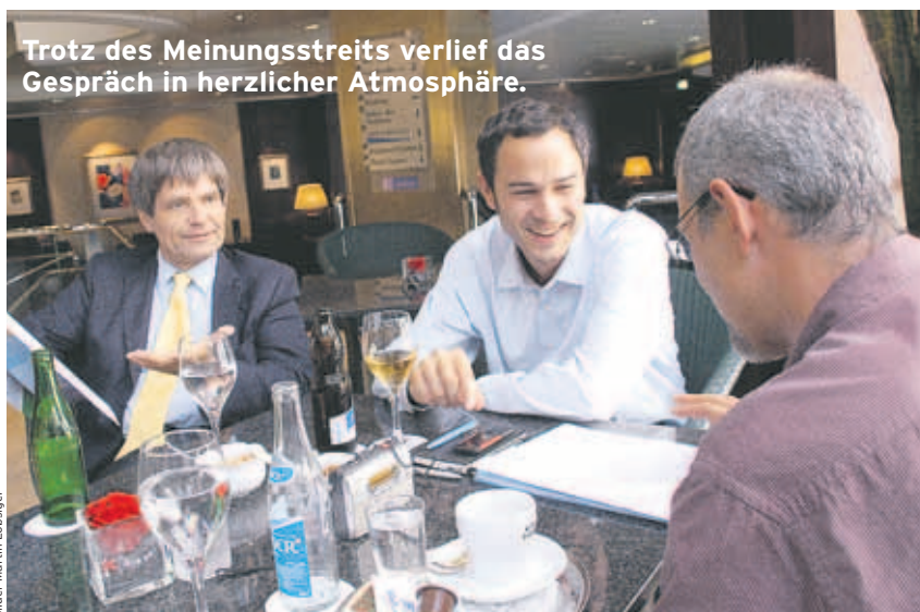
Trotz des Meinungsstreits verlief das Gespräch in herzlicher Atmosphäre.