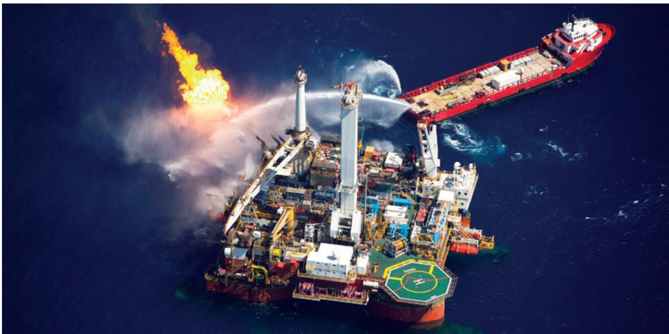
«Deepwater Horizon»: Die Plattform wurde 2001 in Dienst gestellt; die Firma Transocean betrieb sie im Auftrag des Leasingnehmers BP, um damit Ölbohrungen in 5500 Meter Tiefe durchzuführen. Am 20. April 2010 kam es zu einem unkontrollierten Austreten von Erdgas, das explodierte. Die brennende Plattform versank zwei Tage später, und Rohöl floss während Wochen aus dem Bohrloch ins Meer.

85 Millionen Fass, davon 70 Millionen Fass aus konventionellen und 15 Millionen Fass aus nicht konventionellen Quellen. Einen vergleichbaren Energierausch hat es historisch noch nie gegeben.