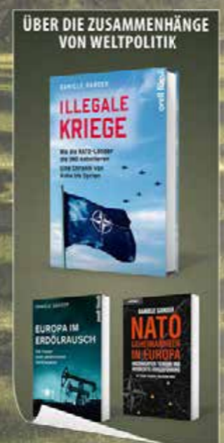
STREIFENPLAKAT »Daniele Ganser« EAN 7640145181283, KNO-Nr. 770638